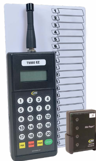
PRZYKŁADOWY ZESTAW PAGERY DIODOWE TRANSMITER TX-9560EZ

System najczęściej wykorzystywany jest w celu wezwania kelnera do kuchni po odbiór gotowego dania. Dzięki temu klient otrzyma zamówioną potrawę w możliwie najkrótszym czasie od jej przygotowania. Jednocześnie kelner nie musi tracić czasu na sprawdzanie czy zamówienie jest już gotowe, a pozostając na sali jest cały czas do dyspozycji klientów.