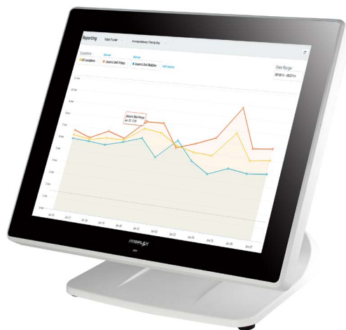
ŚREDNI CZAS DOSTAWY W MINUTACH PER DZIEŃ W 3 RESTAURACJACH